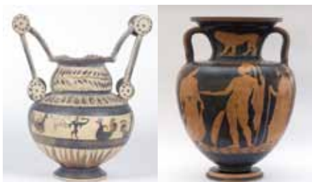
Museo archeologico/ The Archaeological Museum