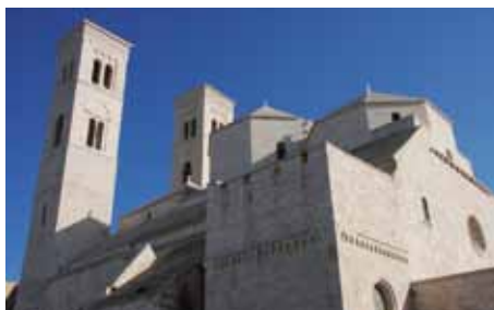
Molfetta - Cattedrale/The Cathedral