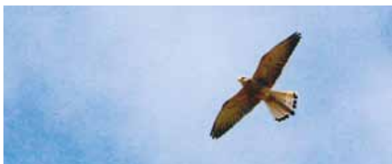
Falco Grillaio/Naumann Hawk

"Puli" and swallow-holes. The substratum is made of Cretaceous limestone, generally covered by Pleistocene limestone. The Park is one of the most extended sub-steppe area of Italy and Europe. It is populated by a large Italian family (the first of Europe) of hawks of a protected species called "Grillaio" ( Gryllus ). It is also the topic of the project sponsored by the Park Authority, "Grillai in mind", which will be planned in occasion of the Palio of Alta Murgia and it includes 13 towns surrounding the Park. It will be organized an opening night on July 16th and a closing one, that is the "Grillaio Night" on September 10th.