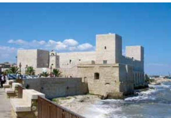
Trani - Castello/The Castle