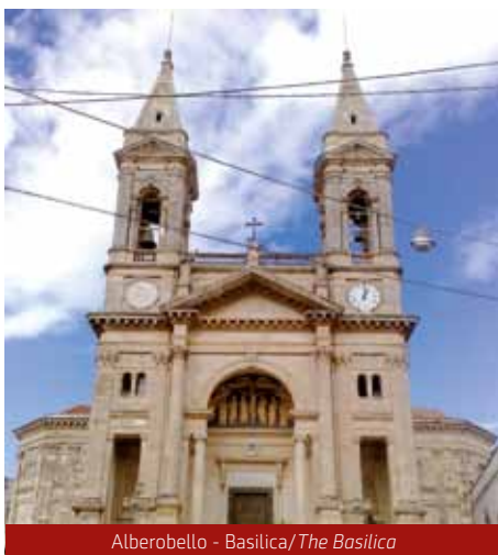
Alberobello - Basilica/The Basilica