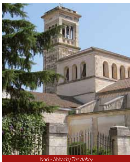
Noci - Abbazia/ The Abbey