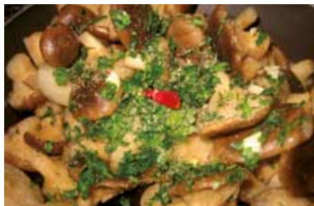
Funghi Cardoncelli/Cardoncello mushrooms

(Claf's liver) August 16 th "Fungo Cardoncello" Village fair (Mushroom)