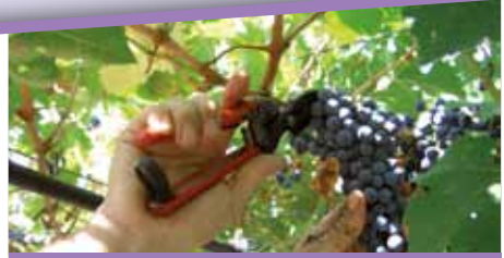
Vendemmia dell'uva/The grapes harvest