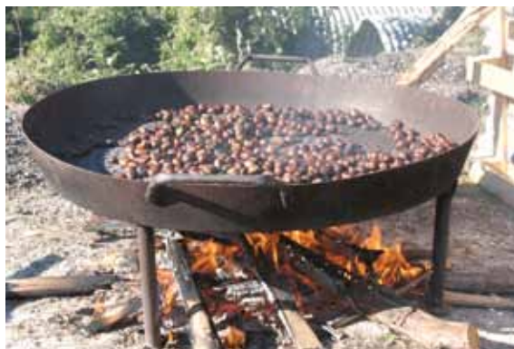
La cottura delle castagne/The baking of the chestnuts

"Pettole nelle Gnostre e cioccolato" Village fair