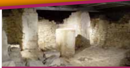
Bari - Succorpo Cattedrale/The Cathedral foundations