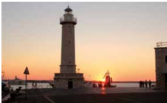
Molfetta - Faro/Lighthouse

Nuovi percorsi lungo le vie del mare per visitare le città partendo dal porto, riscoprendo centri storici costruiti intorno alle cattedrali e ai castelli, sorti a ridosso del mare e punti di riferimento per i viaggiatori di ogni tempo.