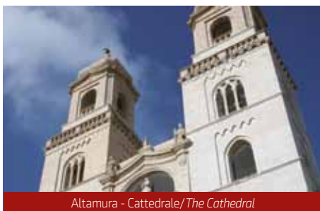
Altamura - Cattedrale/The Cathedral