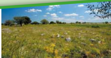
Parco Nazionale dell'Alta Murgia/Alta Murgia National Park

The beautiful landscape of the Park is set up by gentle undulations and troughs of Dolines, with surface distinguishing karstic marks of