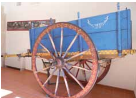
Altamura - Museo etnografico/ The Ethnographic Museum