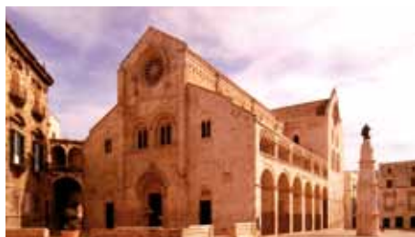
Bitonto - Cattedrale S.Valentino/The Cathedral of S.Valentino

CATTEDRALE SAN VALENTINO THE CATHEDRAL OF S. VALENTINO