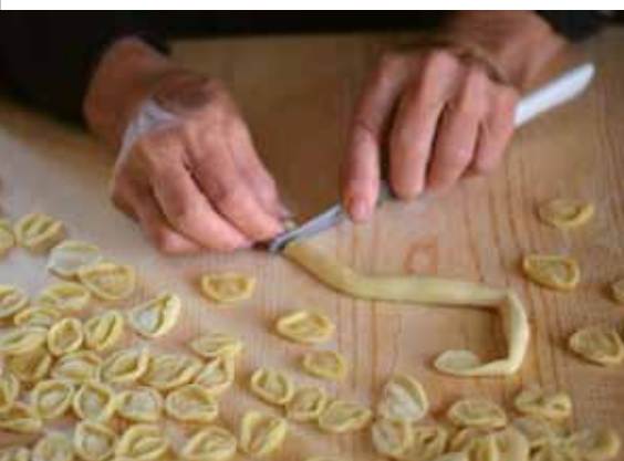
Le "Strascinate" pasta fatta a mano/Hand-made pasta

The tours for the educational farmhouses, free or for a fee, will show the everyday life in the countryside closer to the nature.