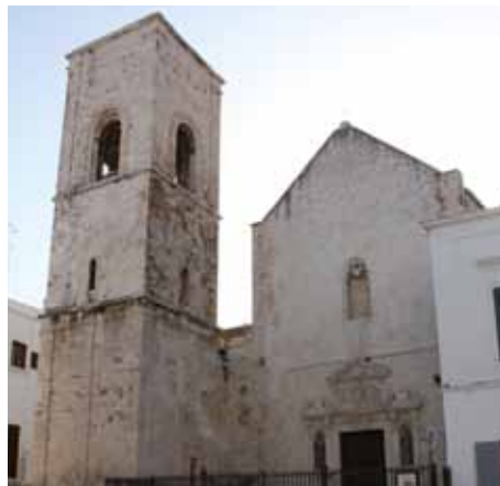
Polignano a Mare - Chiesa Matrice/ The Mother Church