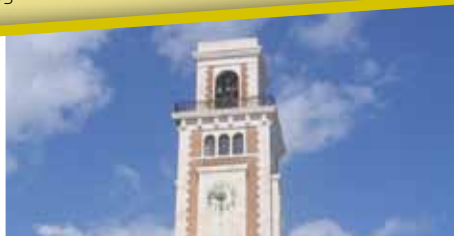
Bari - Pinacoteca Provinciale/The Provincial Picture Gallery