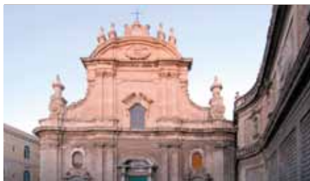
Monopoli - Cattedrale/The Cathedral