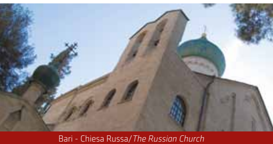
Bari - Chiesa Russa/The Russian Church