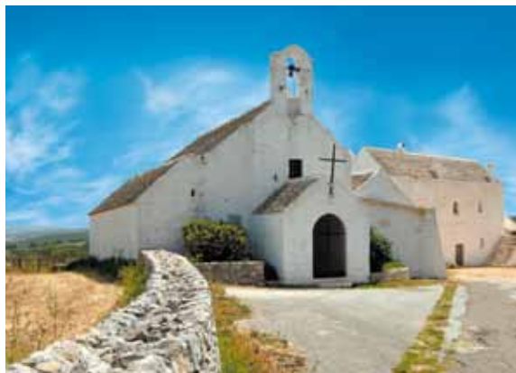
Monopoli - Barsento

Tour in the South hinterland of Bari: the tour is for the tourists residing only in the towns of Mola di Bari, Polignano a mare, Monopoli, Castellana Grotte, Putignano, Noci,