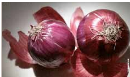
La cipolla rossa di Acquaviva/The red onion of Acquaviva