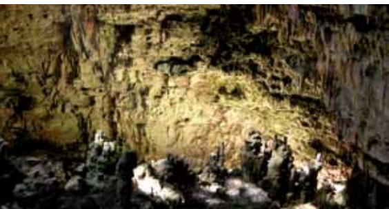
Grotte di Castellana/The Caves of Castellana

New itineraries along the coast to visit the towns from the port and to rediscover the old towns built around the cathedrals and the castles which stood up behind the sea as point of reference for travellers of different epochs.