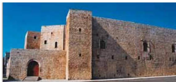
Sannicandro di Bari - Castello/The Castle