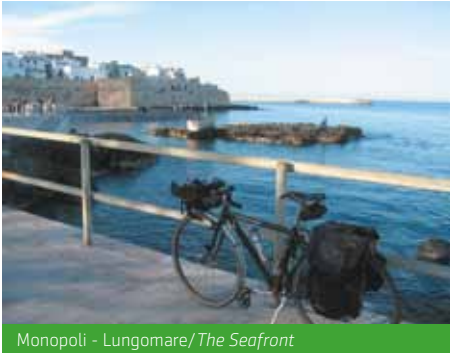
Monopoli - Lungomare / The Seafont

The prospective hire of bicycles and local transfers are at participants' expense.