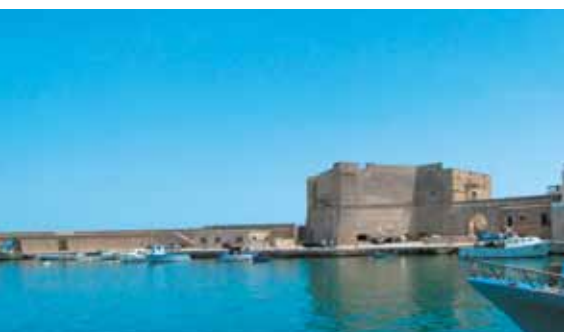
Monopoli - Castello/The Castle

STREET BAND SHOW è un originale festival on the road di grande impatto sonoro e