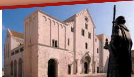
Bari - Basilica di San Nicola/The Basilica of S. Nicola