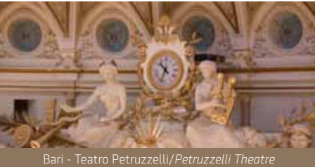
Bari - Teatro Petruzzelli/Petruzzelli Theatre

Guided tours: July 4 th -11 th -18 th 2pm/3pm/4pm July 5 th 1pm/2.30pm/3.30pm/4.30pm/5.30pm July 12 th 1pm/2.30pm/3.30pm/4.30pm/5.30pm/6.30pm July 19 th 2.30pm/3.30/6.30 July 21 st 9am/10am/11am/12pm/1pm/2pm Info and reservations: Tel. 080.975.28.40 from Monday to Friday 10am-1pm/5pm-7.30pm Tel. 334.661.99.63 - 9.30am-12pm/1pm-2pm