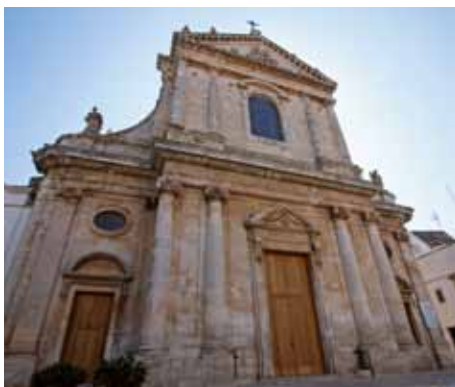
Locorotondo - Chiesa Madre/The Mother Church