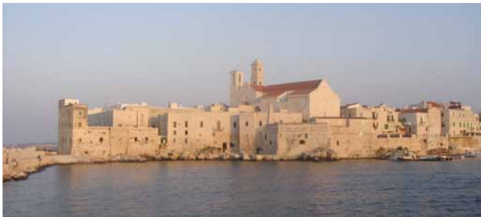
Giovinazzo - Il Porto/The harbour