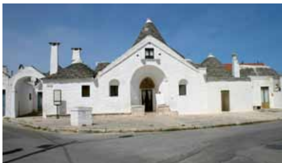
Alberobello - Trullo Sovrano