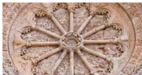
Putignano - Chiesa Madre/ The Mother Church