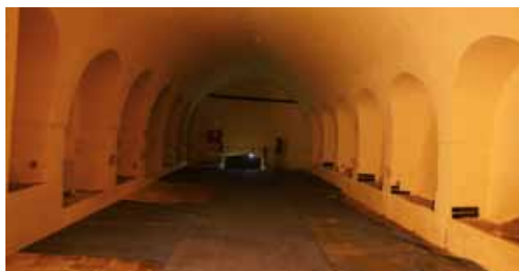
Gioia del Colle - Distilleria/ Distillery