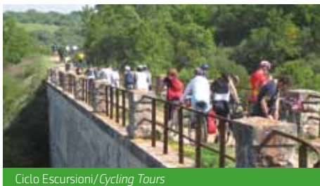
Ciclo Escursioni/Cycling Tours

Services included: mountain bike, expert