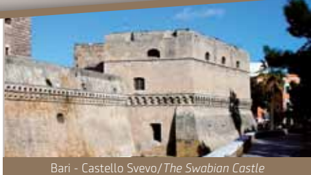
Bari - Castello Svevo/The Swabian Castle