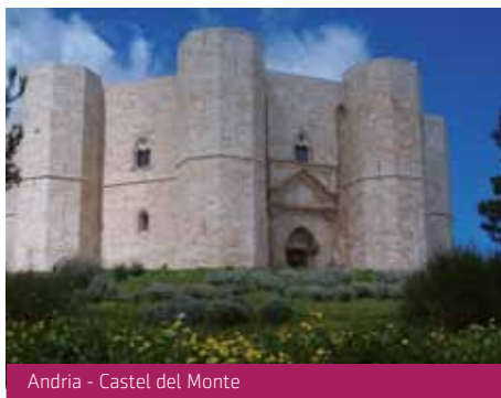
Andria - Castel del Monte