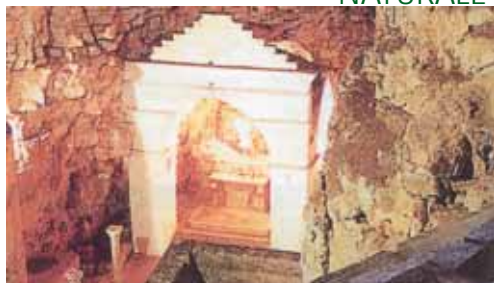
Minervino-La grotta di S. Michele Minervino-The Grotto of S. Michele