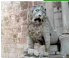
Altamura - La cattedrale Altamura - The Cathedral

Oltre alla storia ed alla cultura, Altamura offre al viaggiatore specialità gastronomiche tra le quali spicca il tipico pane locale, a marchio D.O.P., di grano duro e semola, cotto nel forno a legna.