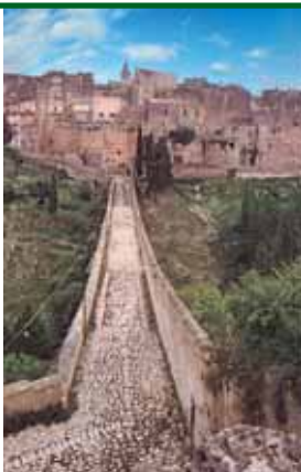
Gravina-Il ponte della gravina Gravina-The ravine stone bridge

Importante tappa della visita è la Cattedrale eretta a partire dalla dominazione normanna. La chiesa si affaccia sul particolare paesaggio della Gravina, le cui sponde sono collegate dall'imponente ponte in pietra. Nella città restano i ruderi del Castello di Federico II . La collina di Botromagno è la sede del Parco Archeologico.