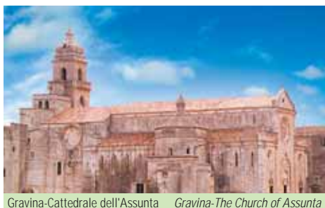
Gravina-Cattedrale dell'Assunta Gravina-The Church of Assunta

was begun under the Norman domination. The church overlooks the ravine which is crossed by an impressive stone bridge. The town also has the remains of Frederick II's castle . The Botromagno hill is the area of the archeological Park.