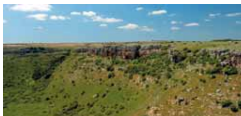
Altamura - Il Pulo

Here in Altamura, known as the "Lioness of Puglia", a famous liberal University was founded, that the proud inhabitants defended fiercely. The surroundings of the town are surprising. In 1993 during exploration of the Grotto Lamalunga, the unique remains of a whole human skeleton of the Paleolithic Age came to light. A discovery equal in importance to that of the Park of Dinosaur . This is an area of 12.00 square metres containing the footprints of these gigantic animals who inhabited the earth in the Cretaceous Age, about 80 million years ago. Besides these historic and cultural interests Altamura offers the traveller gastronomic specialities. The local bread is outstanding: made from durum wheat and cooked in wood fired ovens, it has special denomination (DOP).