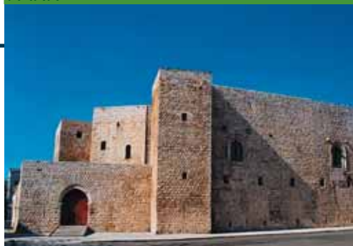
Sannicandro - Castello Normanno

Percorrendo la SP 236, tra mandorli ed ulivi, s'incontrano Bitritto , con il Castello Normanno incuneato nel paese, e Sannicandro di Bari il cui centro è imponente e magnificamente restaurato. Qui si erge il Castello Svevo con l'ampio cortile in cui si affacciano antiche abitazioni, stalle, magazzini e la grande sala dei ricevimenti, il tutto ora adibito ad attività culturali gestite dal Comune. Passeggiando sull'antico selciato e guardandosi intorno, si sentono rivivere gli usi, le musiche e le leggende dei tempi vissuti tra le mura del Castello, una costruzione modificata dalle Signorie succedutesi che lo adattavano alle proprie esigenze belliche e civili per viverlo pienamente, come oggi fa la comunità, grazie al sapiente recupero della propria memoria storica.