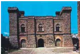
Sammichele di Bari - Il Castello/The Castle

A Sammichele di Bari , dopo aver visitato lo splendido Castello Caracciolo e la zona archeologica di Frassineto con i resti della Abbazia Benedettina , è doveroso gustare, in uno dei tanti locali del centro storico, la tipica "zampina" , una salsiccia arrotolata ed arrostita alla brace alla quale è dedicata una festosa sagra a fine settembre. Durante la settimana del Carnevale, si tengono i "Festini" , balli e rituali mascherati che per giorni si svolgono in tutte le case del paese.