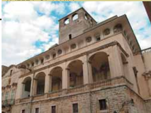
Acquaviva delle Fonti - Municipio/ The town hall

32 km from Bari - 30 minutes (Direct route) Adelfia-Acquaviva delle Fonti: 12 Km - 15 minutes SS100 (Flash Tour route)