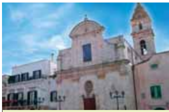
Chiesa del Purgatorio

In the town, which has Roman origins, you can see the Ducal Palace , the Convent of S. Chiara , the Mother Church and the De Bellis Palace now trans- formed into a convent. On the way back to Bari you may stop at the modern shopping mall to do your shopping.