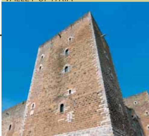
Gioia del Colle - Il Castello/The Castle

Passeggiando nel centro storico tra gli archi medioevali e la Chiesa bizantina di S. Andrea , si possono gustare altri tesori, forse meno nobili, ma altrettanto apprezzabili: il profumato vino primitivo e le squisite mozzarelle.