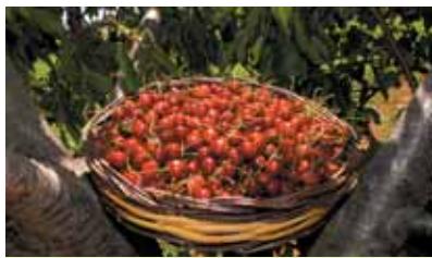
Turi - Le ciliegie "ferrovìa" / The "ferrovìa" cherries

Passando per Turi, famosa per le squisite ciliegie ed il buon vino , troviamo il Convento delle Clarisse adibito poi a carcere, dove furono rinchiusi durante il periodo del fascismo Sandro Pertini, futuro Presidente della Repubblica, ed il filosofo e politico Antonio Gramsci .