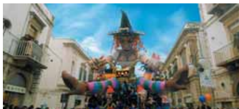
Putignano - Il carnevale

La strada verso Putignano attraversa una campagna solare, allegra come il carattere della sua gente che da tempo immemore festeggia la vita con l'antichissimo Carnevale . Le sue celebrazioni iniziano il giorno di S. Stefano, patrono della città, e continuano tra sfilate di carri mascherati e giornate dedicate a riti ed usanze che coinvolgono tutti in una grande festa. La sua Chiesa Matrice dedicata a S. Pietro, con il suo bel portale ad ogiva e l'ampio rosone che domina la imponente facciata a capanna, ha al suo interno le statue di San Sebastiano e San Pietro realizzate da Stefano da Putignano, il maggiore scultore del Rinascimento pugliese . Nelle immediate vicinanze della chiesa, si trova il Palazzo che per secoli ha ospitato il Bali, il rappresentante del Gran Consiglio dell'Ordine dei Cavalieri di Malta. Putignano, inoltre, è famosa per la produzione di abiti da sposa esportati in tutto il mondo.