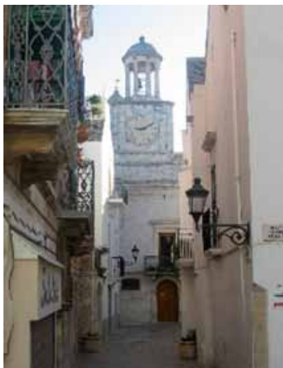
Locorotondo - Il borgo antico/The historical centre

Tra le piazzette delle chiese, tra cui quella della Madonna della Greca che accoglieva i Templari , meritano una visita anche i tanti locali tipici dalle fragranti specialità innaffiate dal profumato bianco DOC locale .