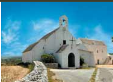
Barsento - La chiesa rurale

Su di essa insiste anche una masseria fortificata , con annessa chiesa rurale , costruita nel 591 dai Monaci di San Equizio.