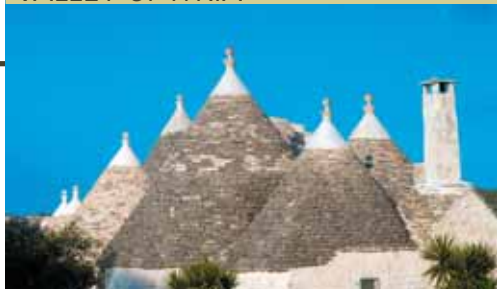
Alberobello - I trulli

È possibile soggiornare in trulli ristrutturati confortevoli e assaporare gustosi piatti di orecchiette fatte in casa .