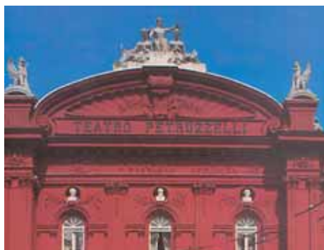
Il Teatro Petruzzelli

Following the tree-lined boulevard of Corso Cavour, on the left we have: the buildings of the Bank of Italy , the Chamber of Commerce and the Petruzzelli Theatre (under restoration, only the foyer has been completed). On the right side of the theatre you have Via Cognetti with the Palazzo dell'Acquedotto Pugliese built in 1932. Inside the decorations of Duilio Cambellotti celebrate the important symbol of water and the Apulian waterworks, which is the biggest in Europe.