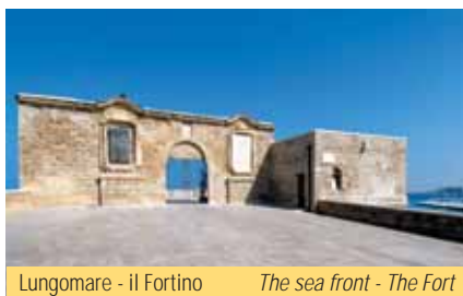
Lungomare - il Fortino

Following the S.S.16 you reach Palese and S. Spirito, two pleasant small villages with small harbours and many places where you can spend pleasant evenings. They are worth visiting because they have preserved their own identity, so picturesque and different from that of the main city.