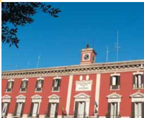
Palazzo del Governo - Palace of the government

It is better to visit its symbolic places to understand the attitude of its inhabitants: faith, trade, the sense of hospitality and a certain independence from authority. After all, Bari is the gateway to the East.