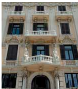
Palazzo Atti - Corso Cavour

The old quarter is rich in patrician residences like the Palazzi Alberotanza, Starita or