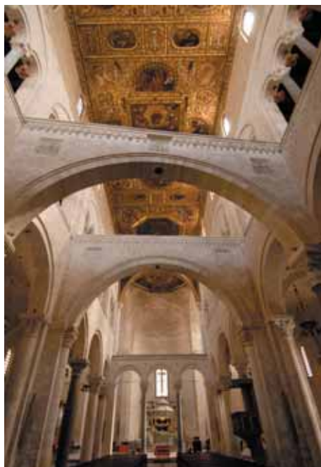
Basilica di San Nicola - Navata centrale

The old town may be considered as an independent town within Bari , lively, with its symbols and traditions such as S. John's Night (on 23rd June). On this day the women of the old quarter make the "orecchiette" by hand (a typical Apulian pasta) and offer them as a good omen and sign of hospitality. This is a typical traditions in the city of S. Nicola, the thaumaturgist and Patron Saint of children. The wonderful Basilica was built for his cult, a great Romanesque church which hosts in the crypt the bones of S. Nicola stolen from Mira by 62 seamen of Bari. There are two feasts that celebrate the Patron Saint: the first from 7th to 10th May, which attracts pilgrims from all over the world. It is celebrated with an extra-