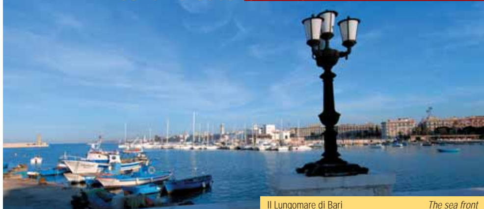
Il Lungomare di Bari