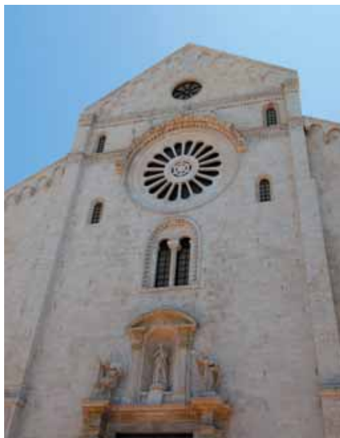
Cattedrale di San Sabino