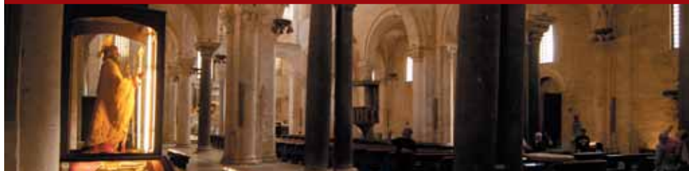
Basilica di San Nicola - Interno e statua del Santo