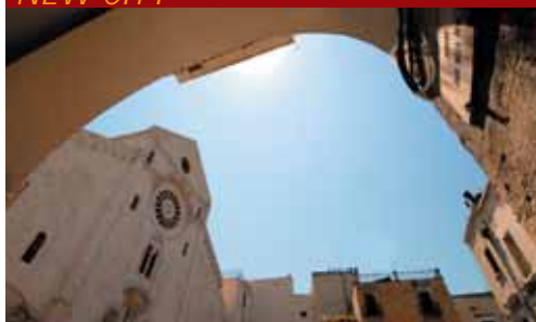
Cattedrale di San Sabino

Percorrendo il viale alberato di Corso Cavour, i Palazzi della Banca d'Italia e della Camera di Commercio anticipano il cantiere di restauro del Teatro Petruzzelli , il cui foyer è stato già completato. A destra del Teatro si imbecca via Cognetti dove troviamo il Palazzo dell'Acquedotto Pugliese terminato nel 1932. All'interno le decorazioni di Duilio Cambellotti celebrano l'acqua, fonte di vita e prosperità, e sottolineano l'importanza del più grande acquedotto d'Europa.