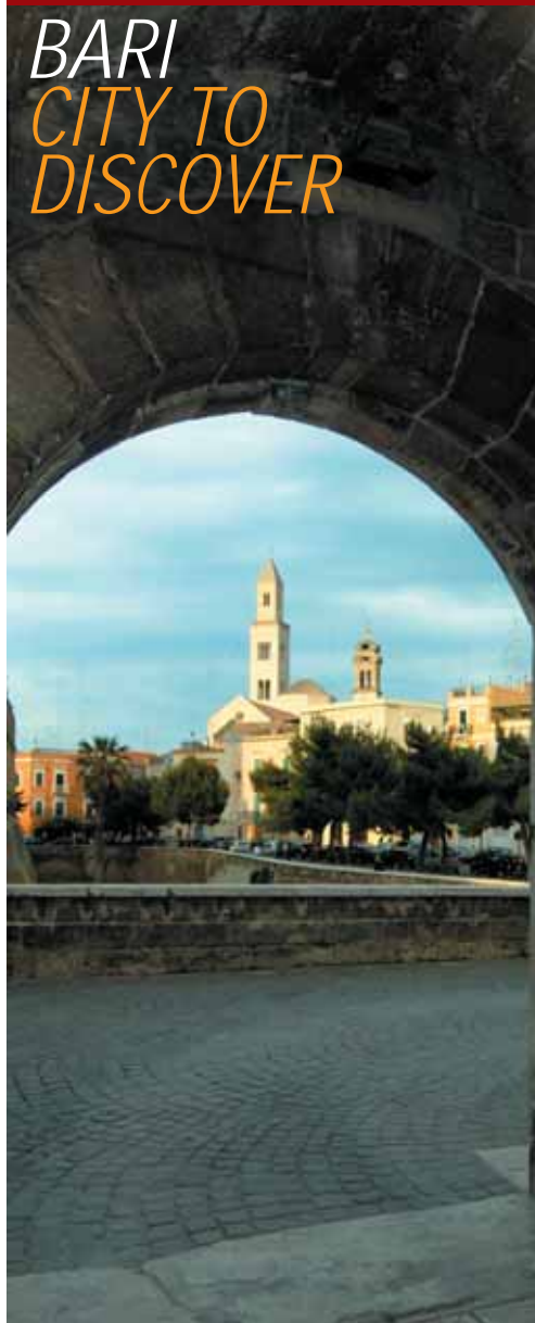
La Cattedrale di Bari vista dal Castello Svevo

La Puglia è stata una terra vissuta e visitata da numerosi popoli.