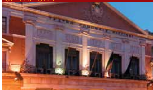
Teatro Niccolò Piccinni